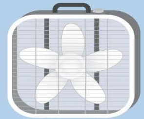
Ventilador de caja de 20" x 20"